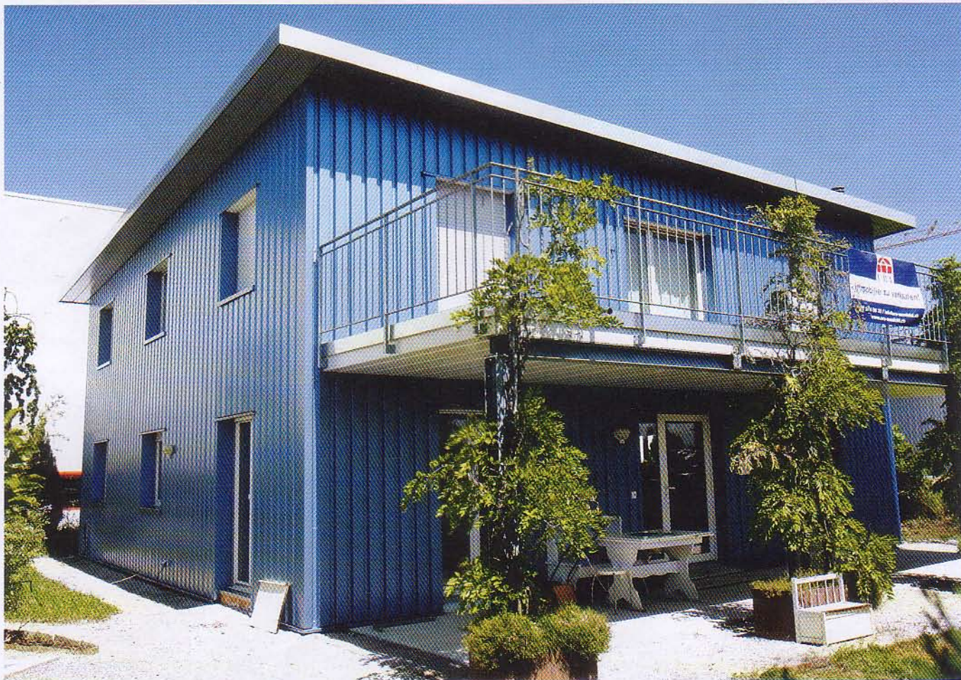
De kliniek van de organisatie Dignitas in het Zwitserse Pfäffikon, waar hulp bij zelfdoding wordt geboden